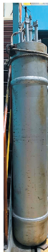
Рис. 1. Ремонтный резерв корпуса исследовательского импульсного реактора «Гидра» [Fig. 1. The repair reserve of the vessel for Hydra reactor]

и радиационной нагрузкам, ударной динамической нагрузке в момент импульса делений ядерного топлива, коррозионным повреждениям при нагревании солевого топливного раствора, динамическому воздействию химического взрыва гремучей смеси в период физического эксперимента, является опасным конструктивным элементом. Корпус ИИР «Гидра» является наиболее нагруженным компонентом исследовательской установки и приоритетно определяет ее общую ядерную и радиационную безопасность, противоаварийную устойчивость к возможным событиям разрушительного и пожароопасного характера. Корпус ИИР представлен на рис. 1 [1, 4].