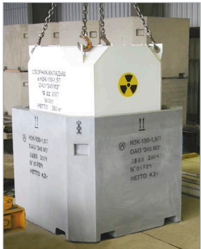
Рис. 1. Внешний вид контейнера НЗК-150-1,5П с вкладышем