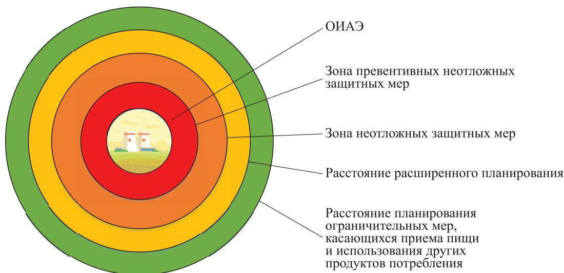
Рис. 2. Зоны и расстояния противоаварийного планирования для объектов использования атомной энергии I и II категорий по аварийной готовности

Также важно отметить, что, в соответствии с подходами МАГАТЭ [4], противоаварийное зонирование не ограничивается только определением